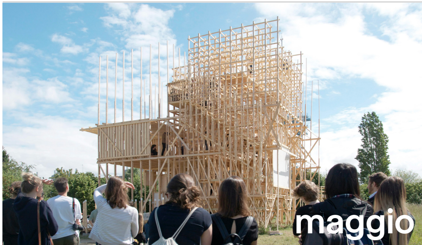
© House 1 ateliers Alice EPFL