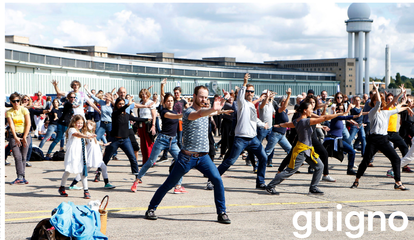
Boris Charmatz

Un'architettura monumentale vede la luce. Si può salire, guardare, sistemarsi. Si riscopre il paesaggio da un'altra angolazione, quasi dal cielo. Ciò che serviva come via di passaggio diventa un luogo dove riprendersi il tempo. Il centro città si mostra in modo diverso, i Jeudredis Bleus prendono il loro posto, i ristoratori allestiscono le terrazze. Un po' più a est, il Bikini Test festeggia i suoi 35 anni. I Santi di ghiaccio dovranno stare molto attenti.