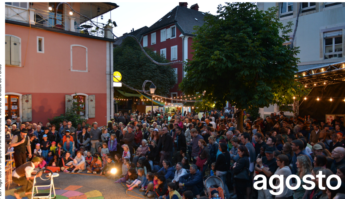
© La Plage des 6 Pompes © Aline Henchoz Ville de la Chaux-de-Fonds

Sulla piazza del Mercato, in collaborazione con il Locarno Film Festival , compare uno schermo, si allineano file di sedie. Un po' come Piazza Grande in versione La Chaux-de-Fonds. Per il calare della notte ci si porta una maglia in più. La città diventa scenografia: il bucato pende dalle finestre, i vicini escono sui balconi, alcuni guardano, altri ascoltano. Il film inizia e ci strappa alle nostre fantasticherie. Con un bicchiere in mano, spritz o limonata, ci si sistema. Le giornate sono lunghe, e anche le serate.